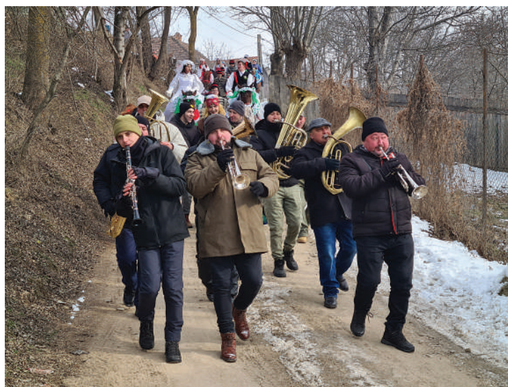
Fotók: Demeter Zoltán, 2025

Első megálló az unitárius papi lak kapuja-udvara, ahol a lelkész köszöntőt mond, megemlíti, hogy miért jó, hogy ezt a hagyományt éltetik. Köszönetet mond a hagyományt ápoló fiataloknak, beszél arról, hogy mit jelent az erdélyi magyarságnak a szokás, az ünnep, és Isten áldásával útnak engedti a menetet, hogy vigyék a hírt: „hogy temetjük a telet, üzzük el a gonoszt, hogy a földre szálljon az Isteni igazság”. Következő állomás a református egyházközség, ahol rövid igehirdetés után vonul a menet tovább a Tökés utca, Bodor utca, Alszeg felé, ahol megfordulnak, bemennek a Kicsi utcába. Ott térnek ki a főútvonalra, onnan Kisbölön, majd a polgármesteri hivatal, ahol szintén köszöntik őket, majd feltérnek a Tana utcába, a Felszegbe és