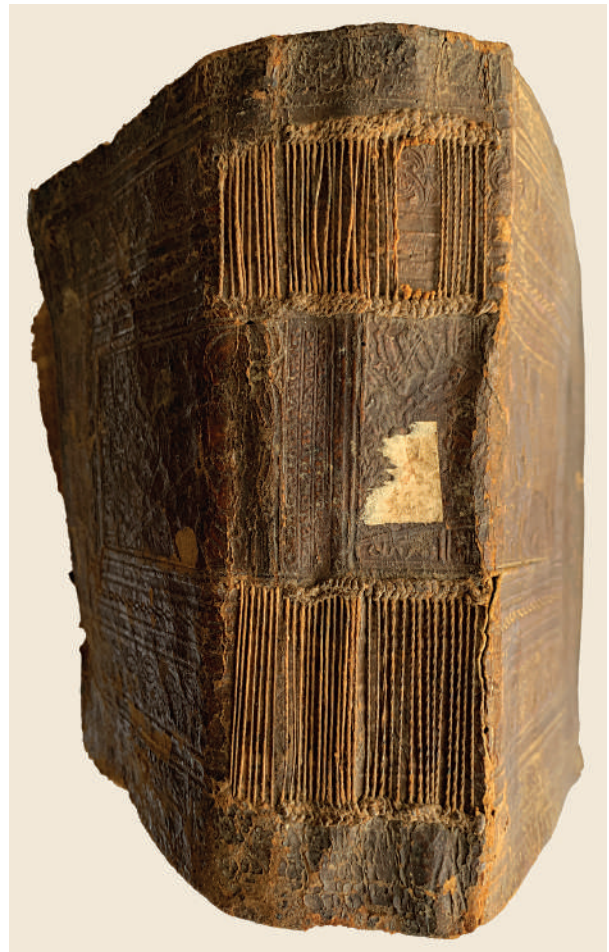
Kéziratos kódex

A 17. századból aztán ismét tetemesebb mennyiségű szöveg maradt fenn, de ennek nagy része nem magyar nyelvű, hiszen például Radecius Bálint németül és latinul írt – ez az anyag jelentős mértékben feltáratlan, a magyar nyelvű szövegekkel való kapcsolata pedig beható vizsgálatra vár.