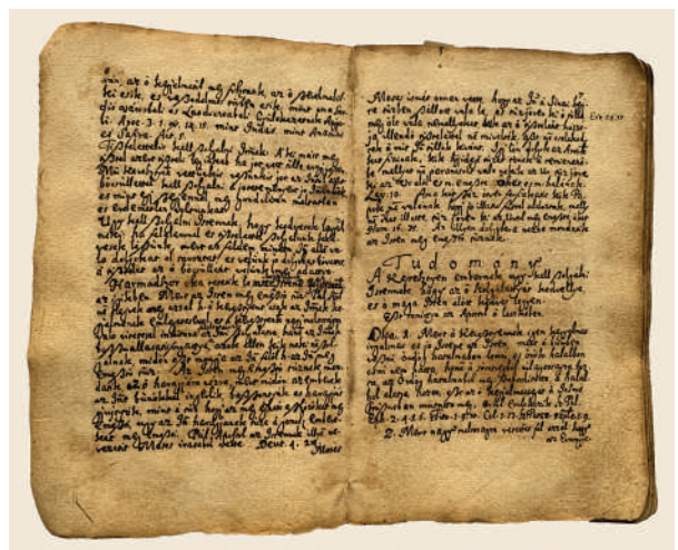
Kézirat kódex

Ezúton is arra szeretnék biztatni egyébként mindenkit, hogyha a padláson vagy a pincében hasonló típusú köteteket, gyűjteményeket talál, mindenképpen értesitse az egyházat, illetve a mi kutatócsoportunkat, hogy ne vesszenek el, sőt legyenek mihamarabb közkinccsé ezek a szövegek.