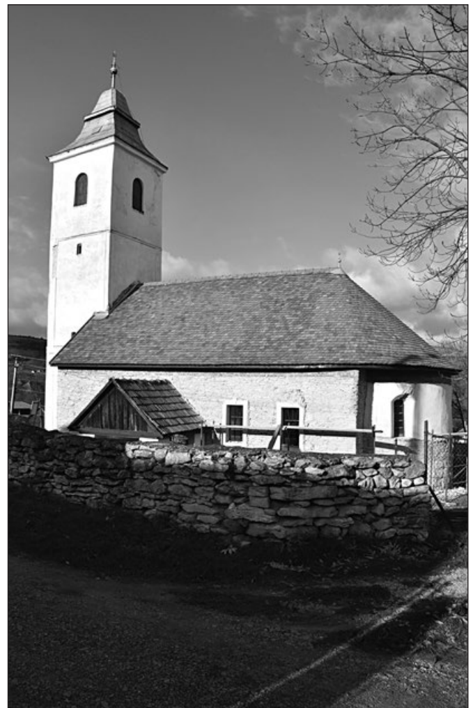
A szindi unitárius templom

A jó hír az, hogy amiként a megmaradásért végzett munkánknak sem látszik a vége, ugyanúgy a maradék szindi magyar közösségünk továbbélése is a jelenlegi emberi látóhatárunkon túlra mutat, ami nemcsak erőt ad a szolgálathoz, de célt és értelmet is biztosít annak.