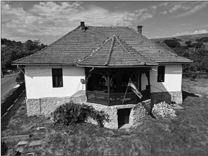
A szindi unitárius paplak