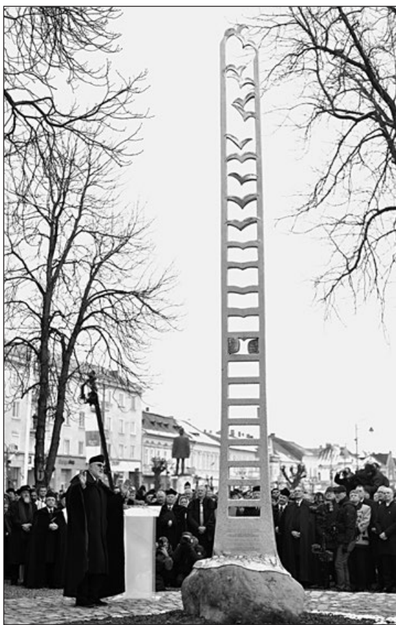
A vallásszabadság tordai emlékműve

Januárban, egyházunk születésnapján ez az egység legyen a mérvadó. Ez az egység és teljesség, amelyet együtt, közösen alkothatunk és álmodhatunk, egy nagyobb egységbe tagolódva, amelyet Isten országaként ismerünk. Legyen övé a dicsőség most és minden időben! Az 52. énekünk sorával, a reményteljes jövő bizonyosságával, egységünkbe vetett bizalmammal zárom gondolataimat: „Virágozzék szent vallásunk!” Ámen.