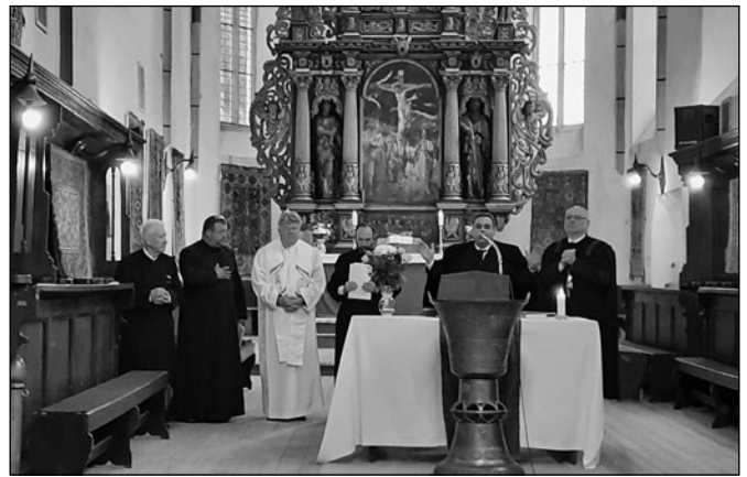
Az evangélikus templomban