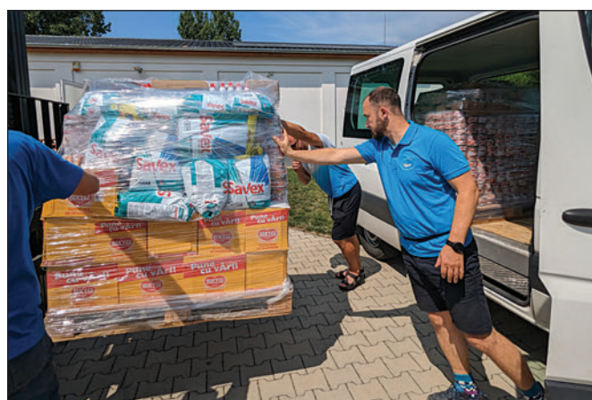
A kilencedik kárpátaljai segélyszállítmány átadása

Fotó: Gondviselés Segélyszervezet, Kiss Olivér. Cikkünk a 21. oldalon.