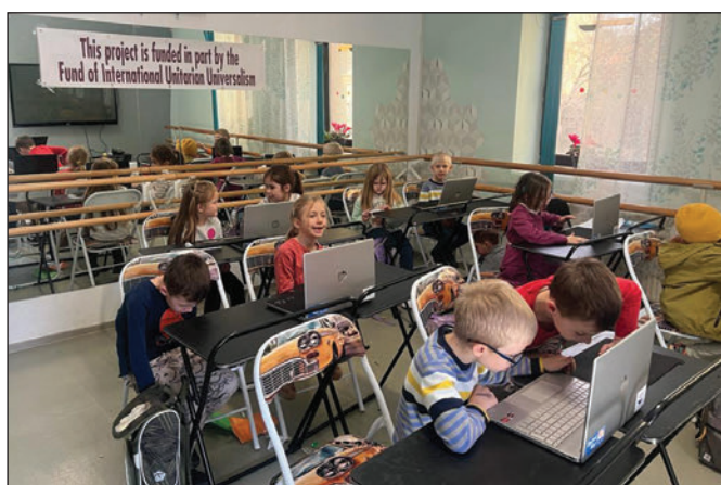
Ukrajnai menekült kisiskolások Kolozsváron