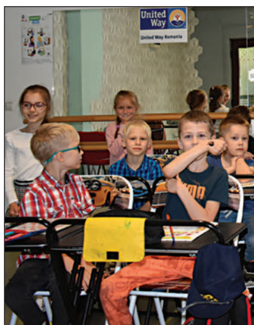
Tanulás közben Kolozsváron