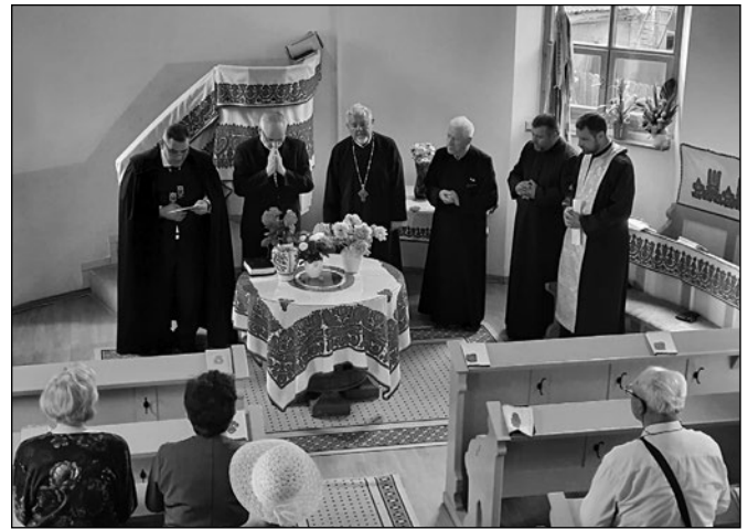
Az unitárius templomban