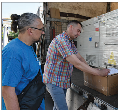
Generátor a mikolajivi kórháznak