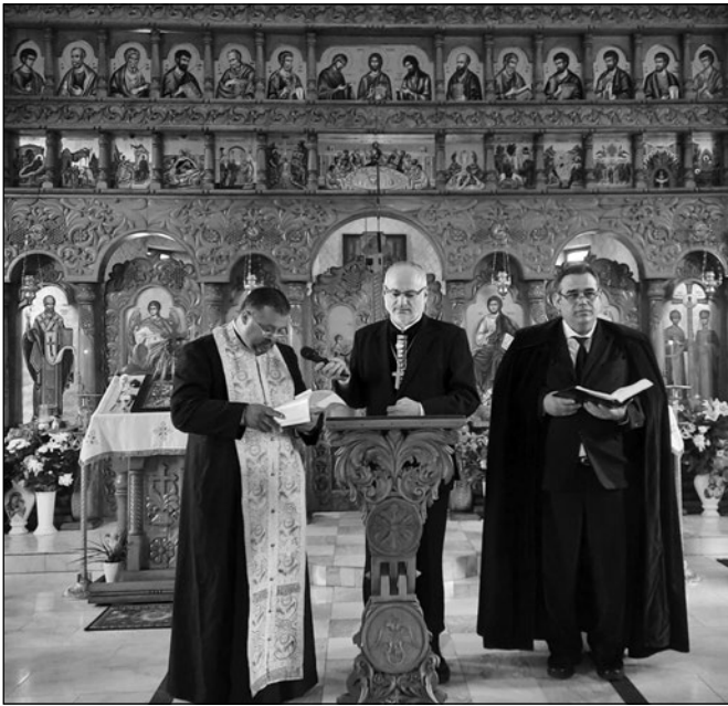
Az ortodox templomban