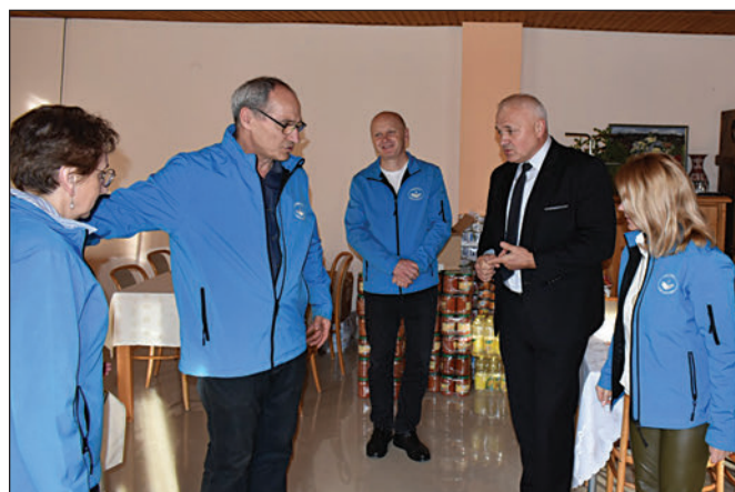
A nyolcadik segélyszállítmány átadása Beregszászon