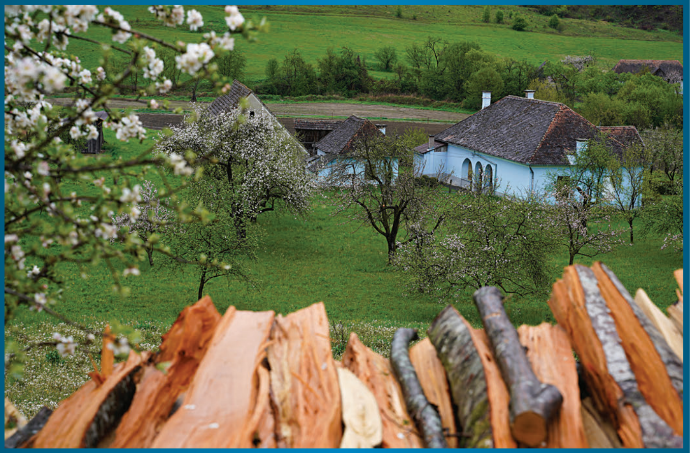
Czíre Alpár: Kék remény (Gagy)

KOLOZSVÁR, 1888–1948/1990. • 32. (92.) ÉVF. • 5. SZÁM • 2022. MÁJUS • ÁRA: 3 LEJ