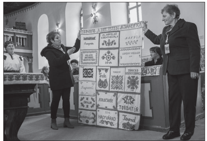
A kövendi nőszövetség tagjai átveszik a köri nőszövetségi abroszt a torockószentgyörgyiektől

A köszöntőbeszéd után ünnepélyes pillanatoknak lehettünk tanúi, amikor a torockószentgyörgyi nőszövetség átadta a féltve őrzött vándorabroszt a kövendieknek, akik az elkövetkezendő évben igyekeznek méltó gondviselői lenni.