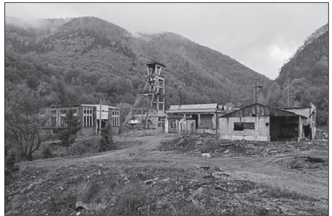
A bărbănteni-i szénbánya