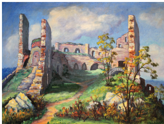
Shakirov Sebestyén: Déva vára

III. Te hogyan képzeled el azt a jelenetet, amikor Dávid Ferenc a kerek kőre állva olyan szépet prédikált, hogy Kolozsváron háromezer ember nyomban eldöntötte, hogy unitárius vallású lesz? Rajzolj, fess vagy gyurmázz, majd kérj meg egy felnőttet, hogy készítsen róla fotót, és küldje el az unitariusgyermekoldal@gmail.com e-mail-címre! A januári számban három kisorsolt mű szerepelni fog a gyermekoldalon. Örömteli alkotást kívánok!