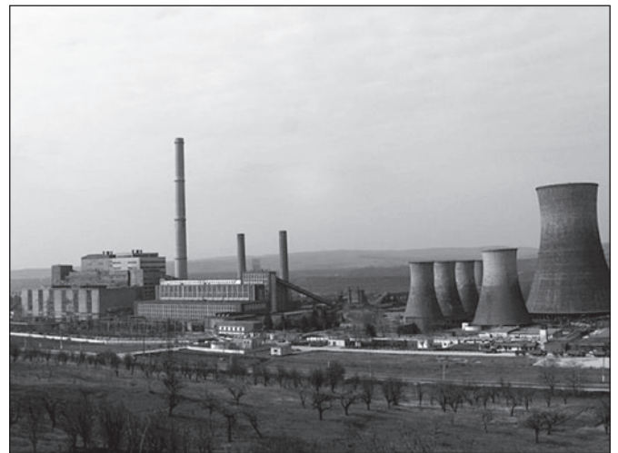
A paroșeni-i hőerőmű (e-nergia.ro)

Brassó irányából érkező vonatot, amelynek utasai is hozzánk csatlakoztak. Az egész társaság mind egy szálíg magyar volt. A hallottak alapján megtudtuk, hogy mint munkás katonákat vagy a bányába, a Duna-csatornához, rizsföldekre, vagy építkezéshez visznek [...]. Ezzel az izgalommal teltek a percek és órák, amikor Piskire értünk. Egyértelművé vált, hogy az úticél a Zsil völgye, a bánya. A kérdés az volt, hogy a bányába vagy az építkezéshez visznek [...]. Petrozsényban, a katonai központban kiderült, hogy a nehézipari minisztérium munkáskatonái leszünk, a paroșeni-i, nemrég beindított hőerőmű szolgálatában. Rövid vonatút után a hőerőmű melletti kis állomáson leszállva, az úton túli hegyoldalban voltak azok a deszkabarakkok, amelyek otthonunknak voltak szánva. A honfoglalás könnyű volt, mert egy lelket sem találtunk a helyszínen. De találtunk rendetlenség-